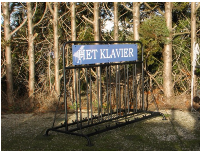
Een duurzame investering: een speciaal ontworpen en gemaakt fietsenrek voor 7 fietsen!