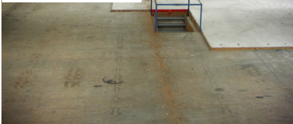
Zolder van Het Klavier

Wat hebben wol en exposities met elkaar te maken? Dat zit zo. Het Klavier beschikt over een prachtige zolder die wij graag willen inrichten als expositieruimte.